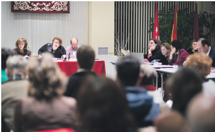
El salón de plenos de la Junta de Hortaleza, repleto de asistentes durante la sesión del pasado 24 de noviembre.

La nueva composición del Pleno de Hortaleza, proporcional a los resultados electorales en toda la ciudad, ha terminado con las mayorías absolutas de las últimas dos décadas. Ahora Madrid y Partido Popular, ambos con nueve representantes, necesitan el apoyo de PSOE o Ciudadanos, con cuatro y tres vocales respectivamente, para sacar adelante sus iniciativas. Una aritmética que sin embargo funciona: diez de las doce propuestas presentadas por los cuatro grupos políticos fueron aprobadas, algunas incluso por unanimidad, como la apertura al tráfico de la avenida Francisco Javier Sáenz de Oiza, que conectaría los barrios de Sanchinarro y Valdebebas y permanece cerrada por falta de alum-