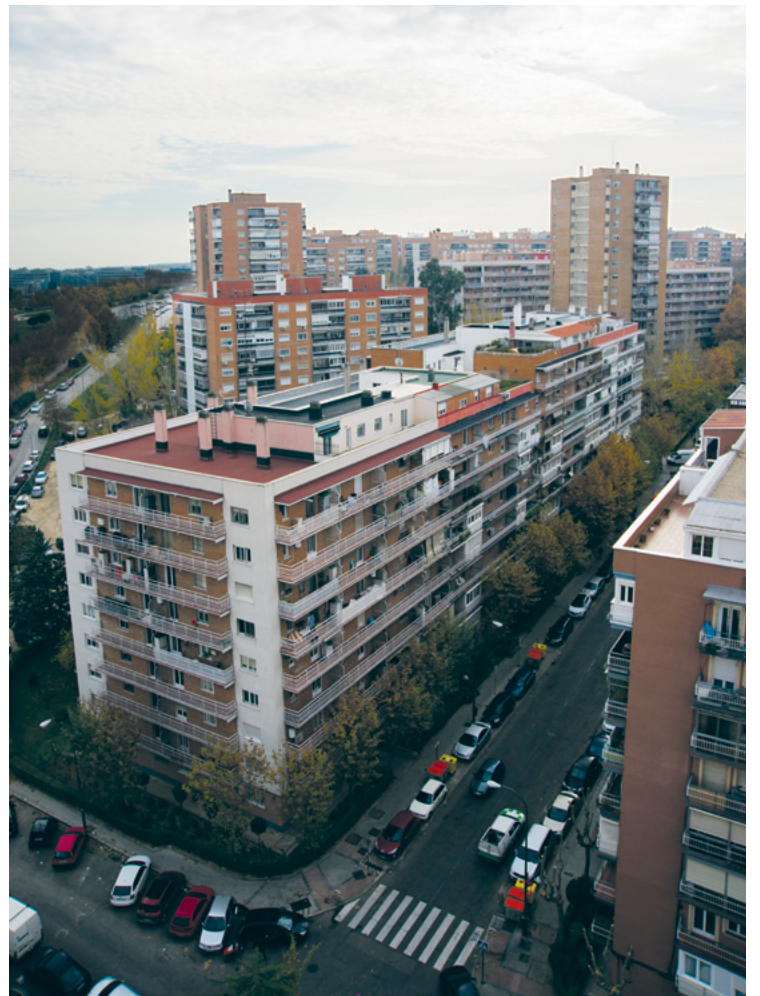
Panorámica del barrio Parque de Santa María, donde se venderán decenas de viviendas, desde la calle Santa Susana.

La familia Miarnau construyó el barrio durante el franquismo, y desde entonces conservó la propiedad de cientos de viviendas