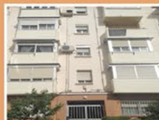
Calle Pinar del Rey