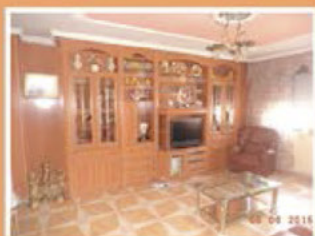
Calle Antonio Saura