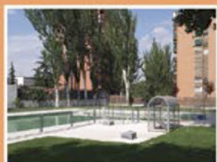
Calle José Domingo Russ