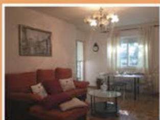
Calle Santa Susana